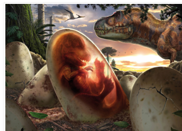
"Tyrannosaurus nest". Franco Tempesta

Suscribirse a: Enviar comentarios (Atom)