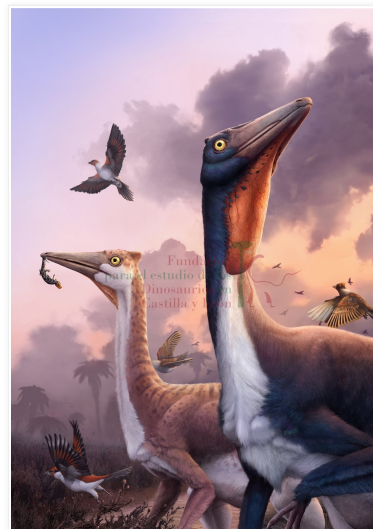
"Amanecer en Las Hoyas". Hugo Salais