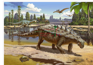
"Dinosaurs of the Isle of Wight". Sergey Krasovskiy

Trabajos seleccionados XII Concurso Internacional de Ilustraciones Científicas de Dinosaurios 2020