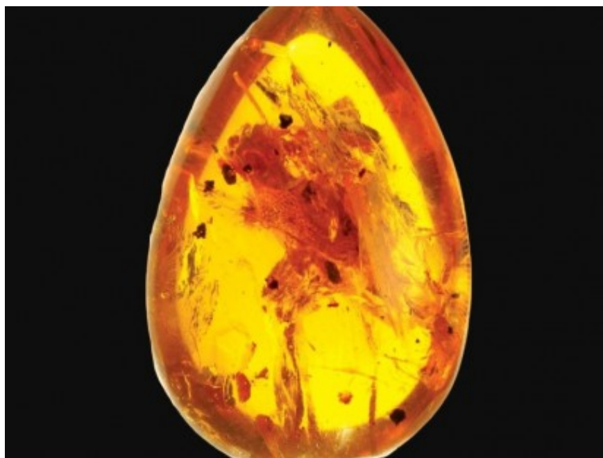
Ejemplar fósil de Yaksha perettii capturado en ámbar.

Publicado por: Elena Camacho | 5 noviembre, 2020 | Madrid | Like